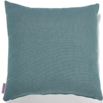
••• Bezug: 65 09 86 ••• Größen: 40 x 40 und 50 x 50