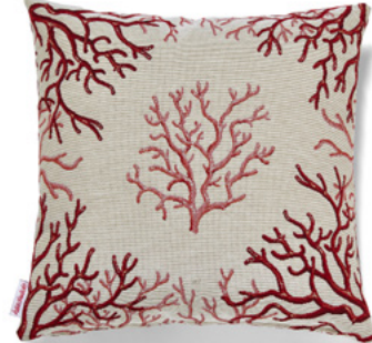
••• Bezug: 65 10 04 ••• Größe: 40 x 40