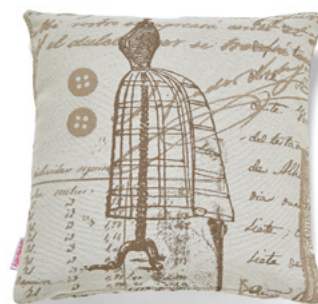
● ● ● Bezug: 65 10 18 ● ● ● Größen: 40 x 40 und 50 x 50