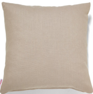
••• Bezug: 65 09 85 ••• Größen: 40 x 40 und 50 x 50