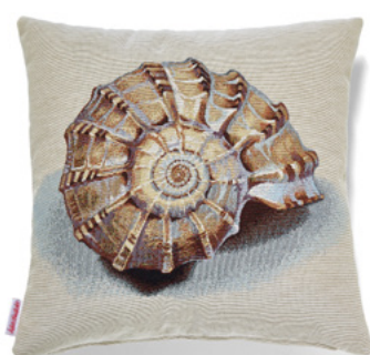
● ● ● Bezug: 65 10 06 ● ● ● Größe: 40 x 40