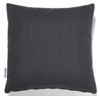
••• Bezug: 65 09 89 ••• Größen: 40 x 40 und 50 x 50