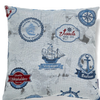
● ● ● Bezug: 65 10 11 ● ● ● Größen: 40 x 40 und 50 x 50