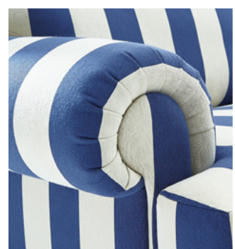
Stimmige Akzente und feinste Machart – bis ins Detail