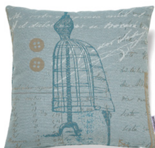
● ● ● Bezug: 65 10 17 ● ● ● Größen: 40 x 40 und 50 x 50