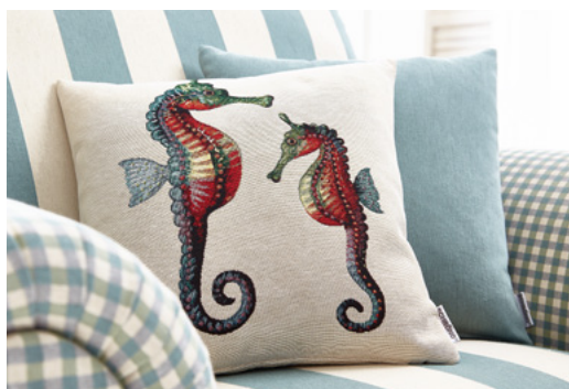
Aparte Details aus der Welt des Meeres