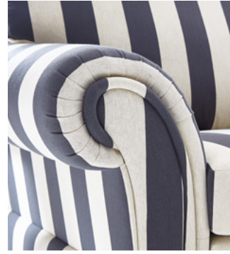
Besondere Details und klare Linien – perfektes Zusammenspiel