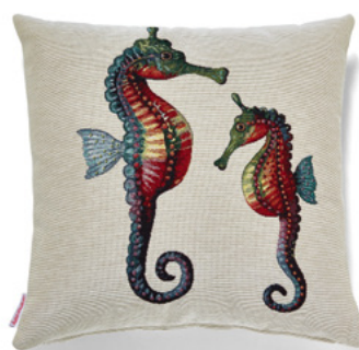
● ● ● Bezug: 65 10 07 ● ● ● Größe: 40 x 40