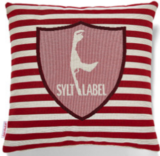
••• Bezug: 65 10 01 ••• Größe: 40 x 40