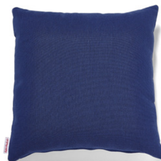
••• Bezug: 65 09 87 ••• Größen: 40 x 40 und 50 x 50