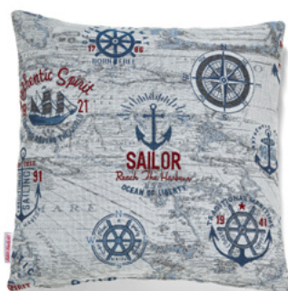
● ● ● Bezug: 65 10 10 ● ● ● Größen: 40 x 40 und 50 x 50