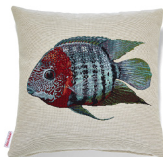
● ● ● Bezug: 65 10 08 ● ● ● Größe: 40 x 40