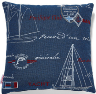
••• Bezug: 65 10 15 ••• Größen: 40 x 40 und 50 x 50