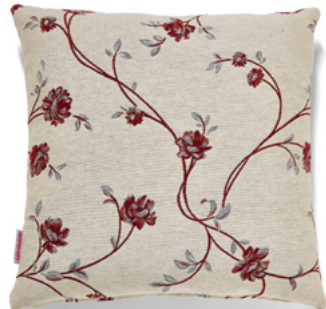
••• Bezug: 65 09 48 ••• Größen: 40 x 40 und 50 x 50