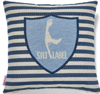
••• Bezug: 65 10 02 ••• Größe: 40 x 40