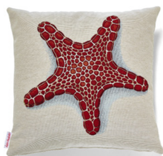
● ● ● Bezug: 65 10 05 ● ● ● Größe: 40 x 40