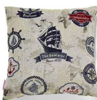
● ● ● Bezug: 65 10 13 ● ● ● Größen: 40 x 40 und 50 x 50