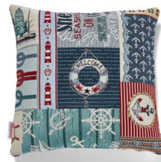
● ● ● Bezug: 65 10 14 ● ● ● Größen: 40 x 40 und 50 x 50