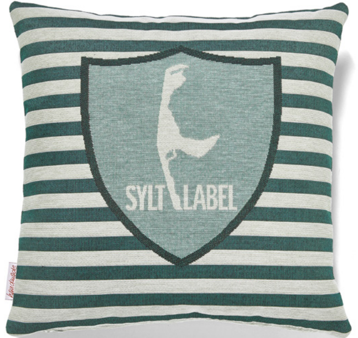
••• Bezug: 65 10 03 ••• Größe: 40 x 40