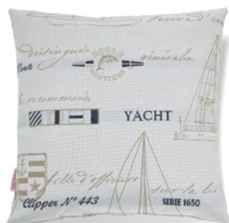
● ● ● Bezug: 65 10 16 ● ● ● Größen: 40 x 40 und 50 x 50

Dekokissen 40 x 40 cm oder 50 x 50 cm sind in allen Bezugstoffen aus der SCHRÖNO Stoffkollektion lieferbar, sowie in diesen speziellen Dessins: