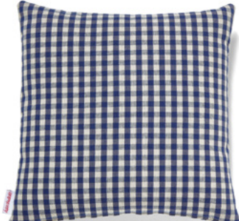
••• Bezug: 65 09 37 ••• Größen: 40 x 40 und 50 x 50