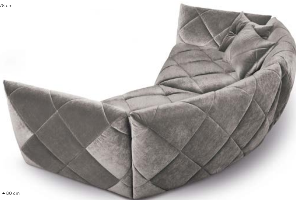
G 106 Teratai ▶ 306 cm ▼ 181 cm ▲ 80 cm Stoff · Fabric · Tissu 66 8480