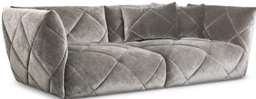
F 106 Teratai ▶ 256 cm ▼ 134 cm ▲ 80 cm Stoff · Fabric · Tissu 66 8480