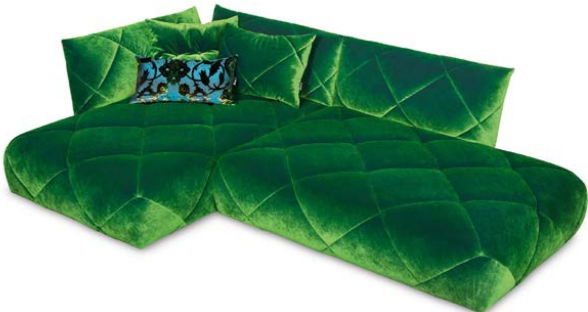
H 106 li Teratai ▶ 299 cm ▼ 190 cm ▲ 80 cm Stoff · Fabric · Tissu 66 8430

Teratai est particulièrement harmonieux lorsqu'il se laisse dériver et se déploie comme une feuille de lotus. Cette perfection organique implique beaucoup de travail manuel et de patience. Pour réaliser la coupe ambitieuse (doucement recouverte, parfois sur l'arête, parfois arrondie, lisse, mais pas trop tendue) chaque losange de tissu a nécessité beaucoup de travail. Les coutures parcourent le canapé comme les veines d'une feuille, conférant un souffle de vie au phénomène naturel en lui apportant volume et structure. La sculpture d'habitation sensible nécessite 22 heures jusqu'à ce qu'elle ne trouble plus l'espace. Le fauteuil rotatif invite à s'y prélasser dans son centre.