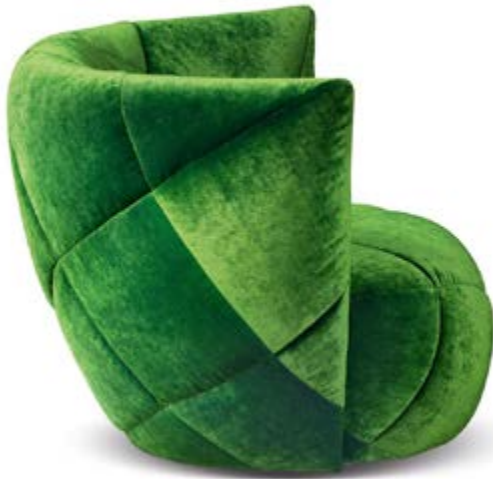
A 106 Teratai ▶ 105 cm ▼ 93 cm ▲ 78 cm Stoff · Fabric · Tissu 66 8430