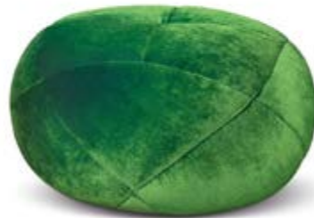
C 106 Teratai Ø 66 cm ▲ 38 cm Stoff · Fabric · Tissu 66 8430