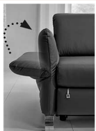
AT 2 - immer klappbar Mehrpreis