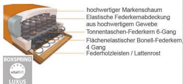
Boxspringsitze mit Bonell-Federkern und Tonnentaschenfederkern