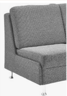
Abschlussblende alternativ zu einem Arm- teil möglich (Mehrpreis)