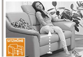
2 Sitzhöhen zur Auswahl