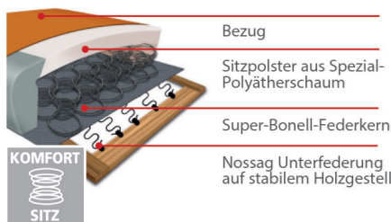
Komfortsitz mit Federkern