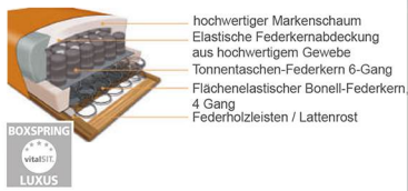
Boxspring Sitz mit Bonell-Federkern und Tonnentaschenfederkern