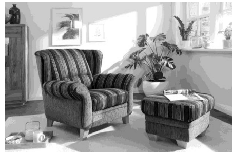
Hochlehnsessel Typ -75 und Hocker Typ -07