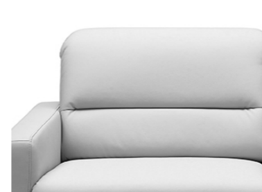
Steppung B (mit Einzug)