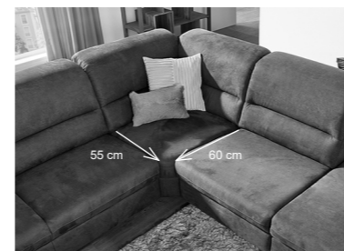
Beide Sitztiefen lassen sich dank Variantenecke in einer Garnitur kombinieren.