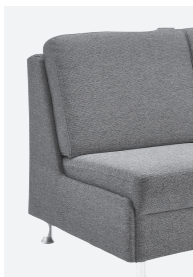
Abschlussblende alternativ zu einem Armteil möglich (Mehrpreis)