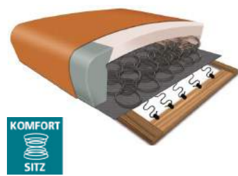
Komfortsitz mit Federkern