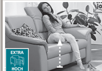
2 Sitzhöhen zur Auswahl