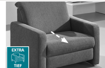
Sitztiefe: 55cm, alternativ: einige Elemente in Übertiefe = Sitztiefe 60cm